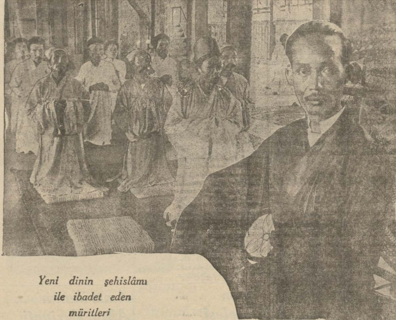
Yeni dinin şehislâmı ile ibadet eden müritleri