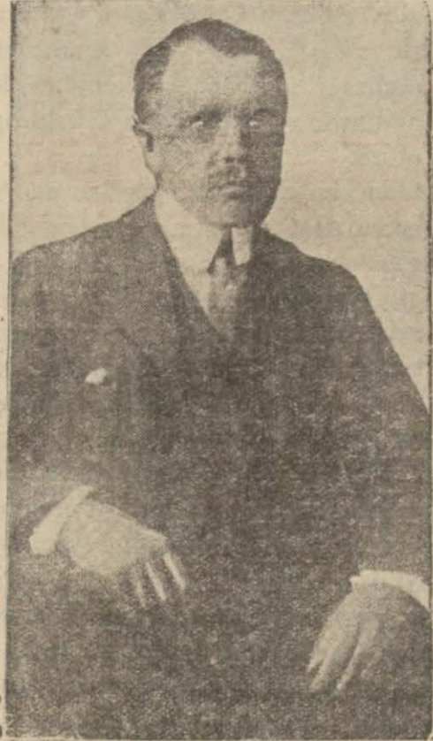
O zamanki Alman Hariciye Müsteşarı Fon Ştum

Denizde gezerken deniz işleri hakkında, maden kuyularına inerken, madenler hakkında projeler tertip ediyordu. İçtimel meseleleri Almanyada tahsil etmişti. Fakat sanayi ve fûnunda behresi olmadığından Alman kuvvetinin en mükemmel tarafı kendisince meçhuldü. Bu itibarla Almanları da ancak Fransızlar kadar severdi. Bununla beraber vaziyeti vüruh ile muhakeme ediyordu.