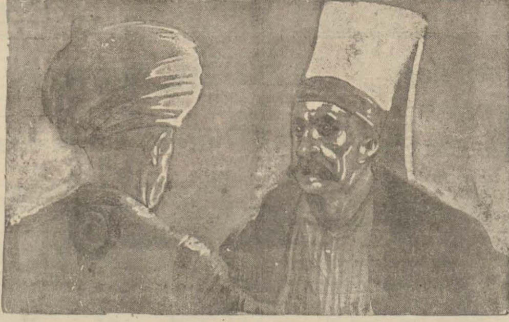
Her kuşun eti yenmez ağa

— Biz gidiyoruz. Bu hayvanlar seni gün doğana kadar bekleyeceklerdir. Canın sana gerek-