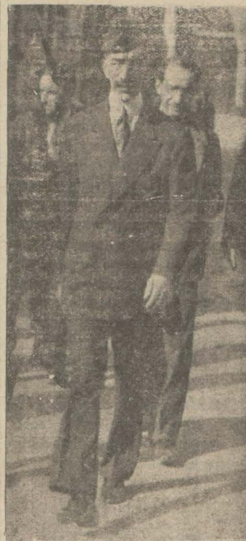
Irak Kıralı Feysal

Bu müddet zarfında erkeklerin kadınlar hakkında besledikleri fikir ve kanaatler de tebeddül etmiştir. Memleketimin ve şarkın kadınları, garp kadınlarıyla mukayese edilecek olursa ekser ahvalde çok geride kalırlar. Fakat Amerikalı ve İngiliz kadınları da Lâtin hemşirelerine nazaran daha asri ve